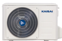
Utomhusenhet KRX AEGO