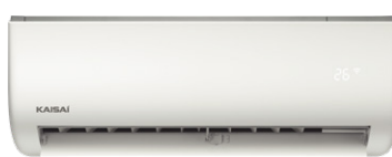
Inomhusenhet KRX AEGI

Klima-Therm AB är en ledande leverantör av kyltekniska produkter och värmepumpar på den svenska marknaden med varumärken som Fujitsu, Fuji Electric, Clivet, Emicon, MTA, Kaisai med flera i portföljen. Klima-Therm AB ingår i den internationella kyl- och ventilationskoncernen Klima-Therm Group med huvudkontor i Warszawa och verksamheter i USA, Polen, Skandinavien och Baltikum.