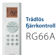
Trådlös fjärrkontroll RG66A